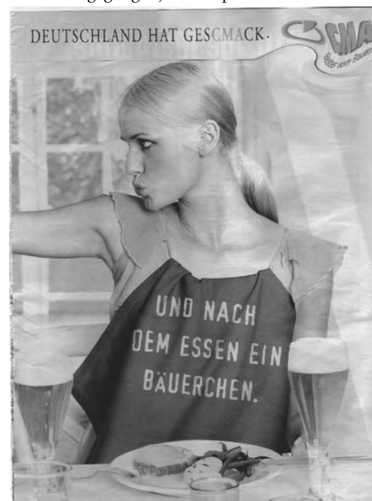
...des schlechten Geschmacks!

gezahlten Abgabenlast erstattet zu bekommen, wird wohl in Musterprozessen geklärt werden müssen. Die Argumentation ist hier, dass die Flaschenhals-Unternehmen eine gewisse Vorsorgepflicht haben, Schaden von ihren Vertragspartnern – hier den Landwirten – abzuwenden. Solange dazu nur ein kostenloser Widerspruch notwendig war, wird man diese Vorsorge-Maßnahme von den Unternehmen verlangen können. Doch, wie gesagt: Auf Druck des DBV ist zumindest die dem Bundesministerium unterstellte Bundesanstalt BLE im Herbst 2007 dazu übergegangen, Widersprüche abzulehnen –